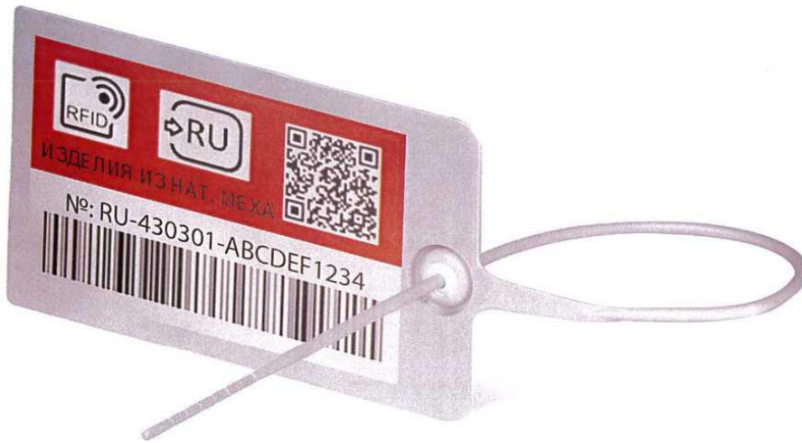
Նկար 3. Հսկիչ (նույնականացման) նշանի պատկերի օրինակը՝ ապրանքի վրա հսկիչ (նույնականացման) նշանը կախովի (վրադիր) եղանակով ամրացնելու դեպքում

1-ին եւ 2-րդ նկարներում օգտագործվող նշումները նշանակում են հետեւյալը՝